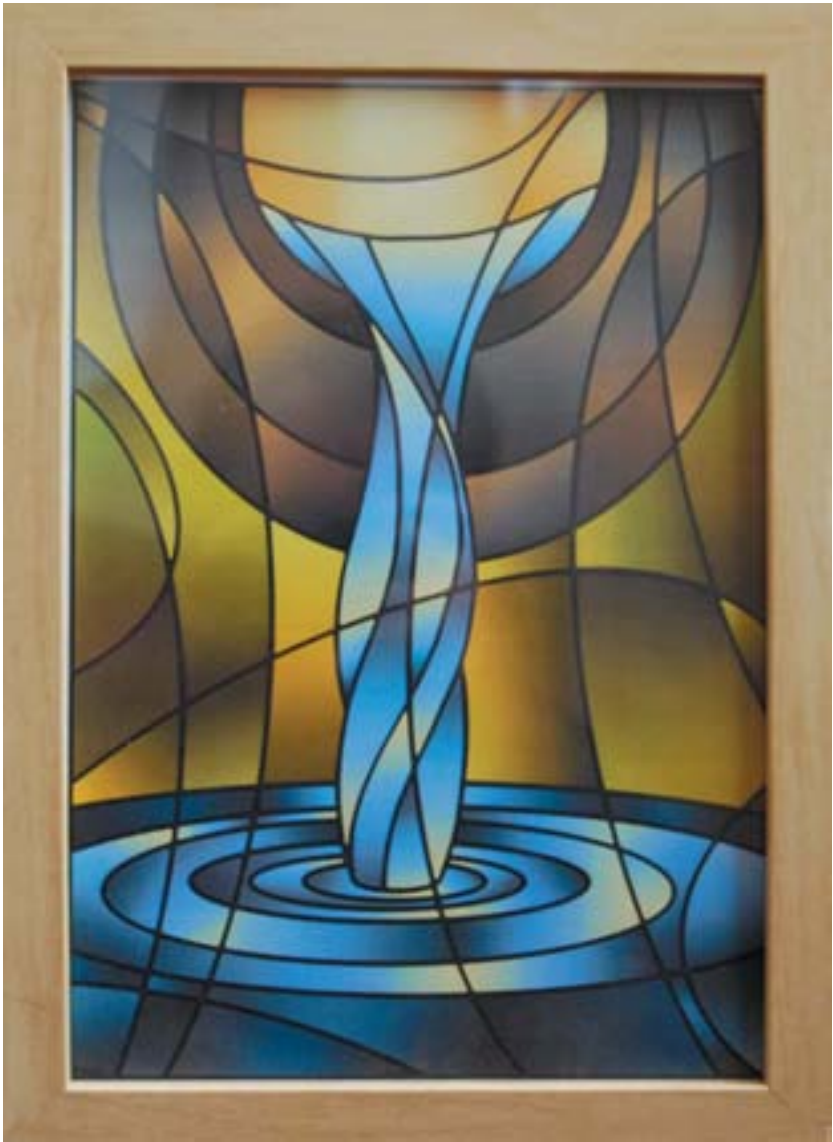
Jezus, het levende water