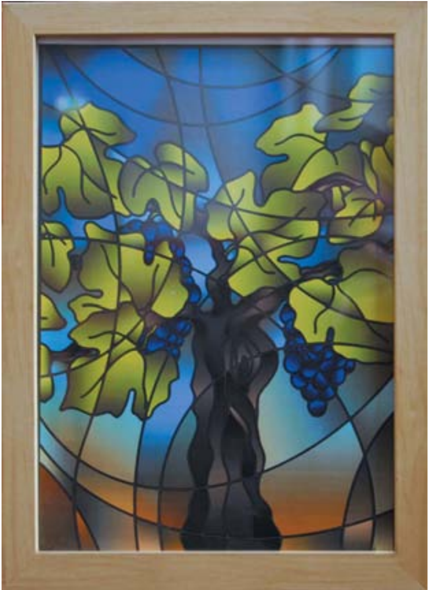
Jezus, de ware wijnstok