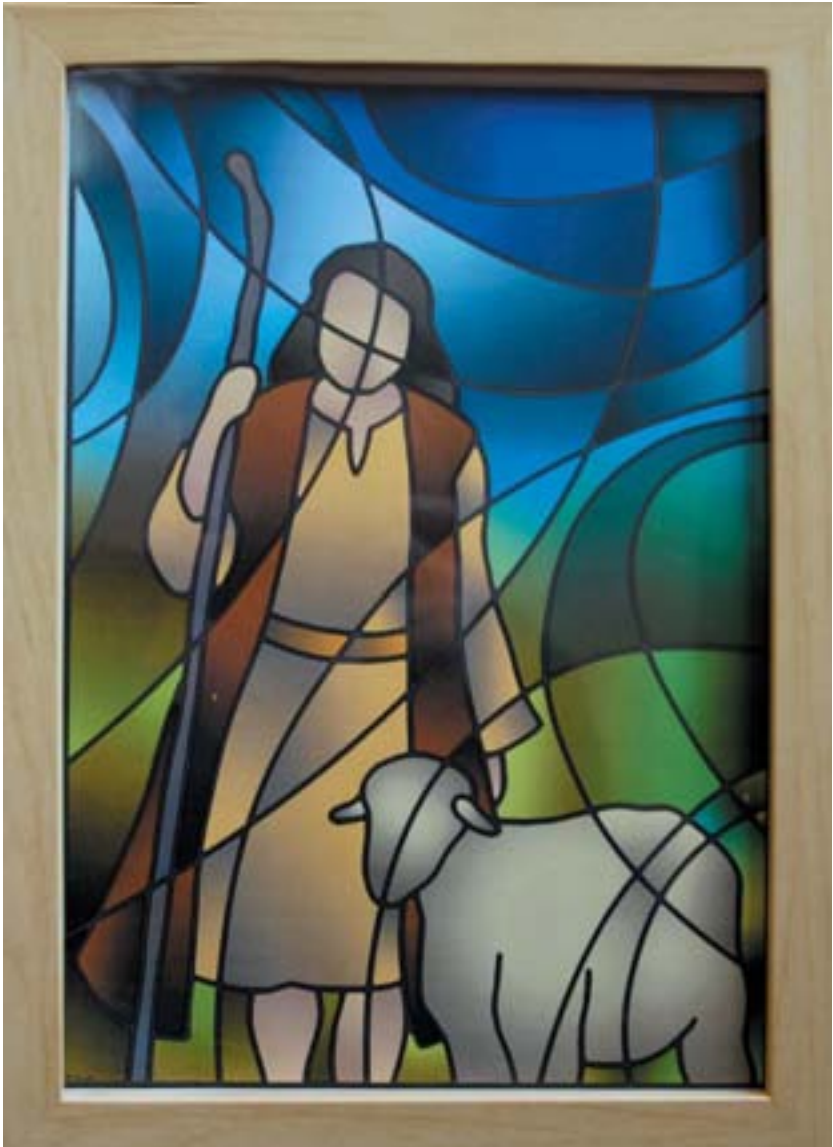
Jezus, de goede herder