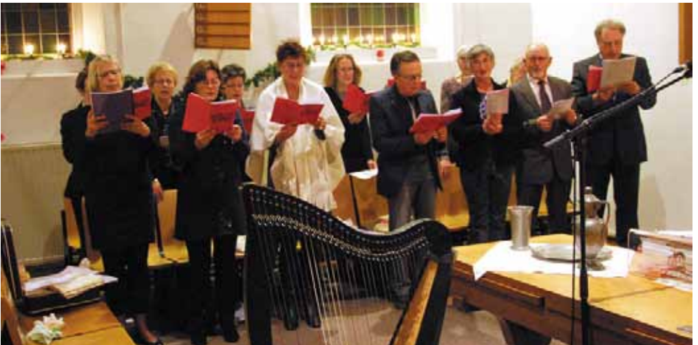
De cantorij tijdens de Kerstnachtdienst 2010.