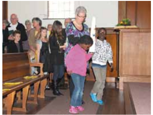
Eieren zoeken in de Tramper en het binnendragen van de Paaskaars.

De kerk is de plaats waar je samenkomt om God te ontmoeten, zoals vele generaties vóór ons ook al deden. Waar het niet gaat om wat je bezit of wat je presteert, maar om wie je bent. Een plaats waar iedereen welkom is.